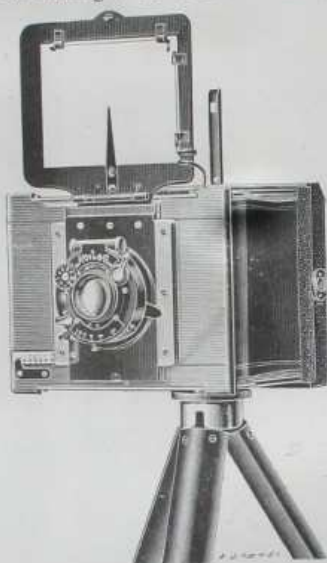
Appareil prêt à opérer

LE NOUVEL APPAREIL 9/12 que nous venons de créer se distingue de tous les similaires, par son faible poids, 800 grammes et par les dimensions extrêmement réduites de la chambre.